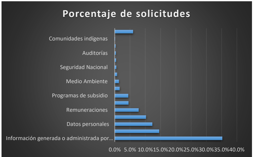
Tabla 2 Solicitudes de información hechas al CISEN de 2003 a 2017.